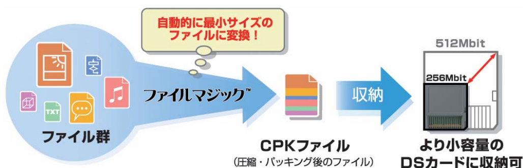
図1. 『ファイルマジック™』による圧縮&パッキング

『ファイルマジック™』は、各ファイルの種類や特性を個別にチェックし、全体として最小のサイズとなるよう自動的に圧縮およびパッキングを行います。これにより、さらに小容量のニンテンドーDS専用カードへ切り替えることが可能になりますので、DS用ソフトの製造コストを削減できるようになります。（図1参照）