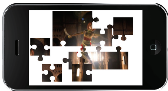
図1：動画でジグソーパズル「ジグ動」

CRIはフジテレビ「ノイタミナ ARブース」にて、iPhone向けの最新動画ソリューションを活用したデモアプリを出展いたします。ノイタミナの動画素材を使い、動画によるジグソーパズル「ジグ動」や、「CRI Sofdec」によるテキストチャムビーを実演致します。