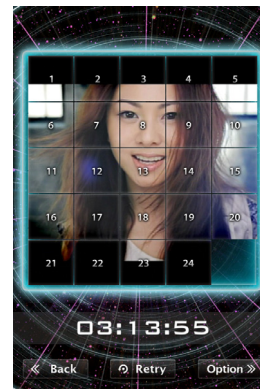
「倉木麻衣★ムービーパズル」

通常、スライド式パズルは静止画像を並べ替えて1枚の絵を完成させますが、本アプリでは24分割された「動画」を並べ替えて Music Clip を完成させます。iPhone/iPod touch のタッチパネルや操作性を活かし、単なる映像ではない“触って楽しい Music Clip”という新しいアプローチを生み出しています。