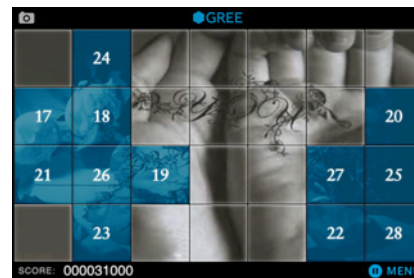
1 から 28 までの数字を順番にタッチ！「順番パズル」