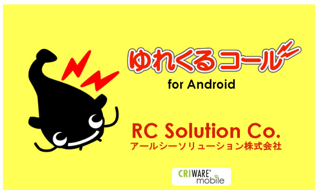
「ゆれくるコール for Android」起動画面