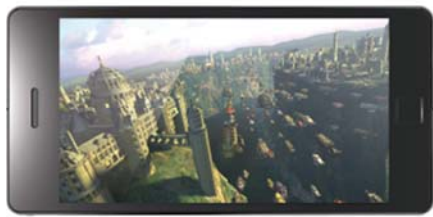
オープニングムービー (全画面再生)