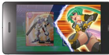
カットイン演出 (αムービーによる画面一部での再生)