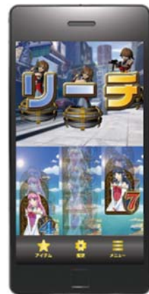
パチスロシミュレーター (大量の演出をムービーで再生)