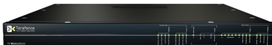
IoT サイバーセキュリティソリューション「Terafence Vsecure (CRI DietCoder 搭載)」

CRI は、イスラエルのセキュリティ対策の専門企業 Terafence 社と共同で、世界で初めて片方向通信アーキテクチャを使ったサイバーセキュリティソリューションを開発しました。